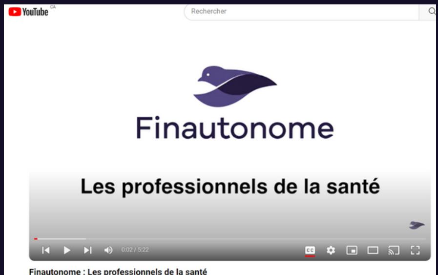
Finautonome : Les professionnels de la santé